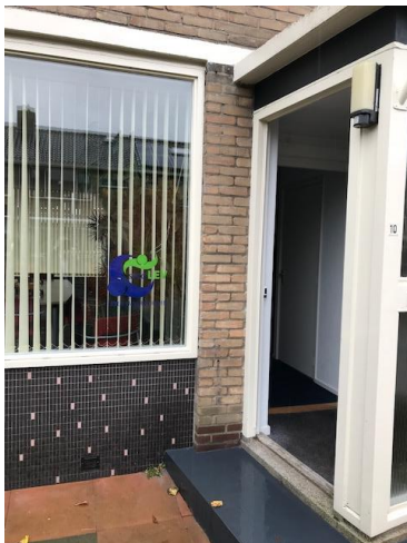
Bestuurskantoor J.W. de Ruijterstraat 10, Boskoop

Ook op het bestuurskantoor zitten we niet stil. De opdracht voor de algemeen directeur a.i. is vastgesteld en op basis van die opdracht is ook het bijbehorende plan van aanpak vastgesteld door het toezichthoudend bestuur. Op een aantal punten is de werkwijze wat veranderd. De algemeen directeur a.i. heeft een aanstelling voor 20 uur per week en is derhalve niet de gehele week aanwezig. In verband met de herkenbaarheid en een goede communicatie komt hij naast de formele contacten ook regelmatig langs op de scholen voor een informeel kopje koffie. De taakverdeling tussen de algemeen directeur en de kwaliteitsmedewerker is duidelijk afgesproken. Onderwijs : kwaliteitsmedewerker