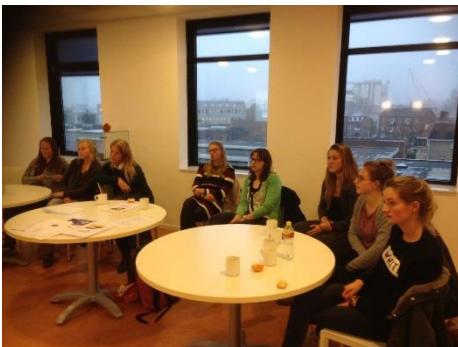
Startende leerkrachten van D4W en LEV

Op woensdagmiddag 15 november ontmoeten startende leerkrachten van LEV en D4W elkaar in ‘het huis van D4W’ aan de Gouwe. We verdiepten het thema van de 1 e Meet Up: Het pedagogisch klimaat van je groep. We interviseerden rond een ter plekke ingebrachte casus en kwam zo tot bruikbare suggesties aan één van de deelnemers. Aan het eind hebben we de behoeften gepeild voor de volgende Meet Ups: Duurzame inzetbaarheid en het onderwerp vitaliteit en identiteit in je werk scoorden hoog. Daar gaan we tijdens de volgende Meet Ups onze tanden in zetten☺